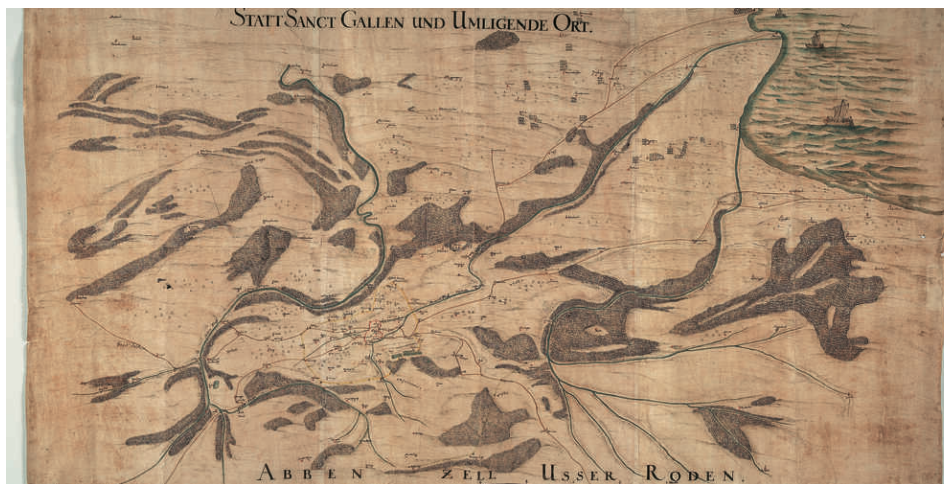
Auf dem Plan der Stadt St.Gallen und der umliegenden Orte um 1683/84 sind oben die Waldgebiete von Bernhardzell und unten jene zur Grenze mit dem Land Appenzell zu erkennen, Johann Jacob Scherer zugeschrieben

Wie gross der Druck auf diese Ressource war, beweisen die Waldordnungen des Hohfirstwaldes von 1483 und des Bernhardzellerwaldes von 1496 in der heutigen Gemeinde Waldkirch. Die Wälder gehörten in das Territorium der Abtei und unterstanden deren Herrschaft und Aufsicht. In diesen Waldordnungen wurden die Holznutzung und der Verkauf zum Schutz des Waldes, aber auch des fürstbischlichen Eigentums massiv eingeschränkt.