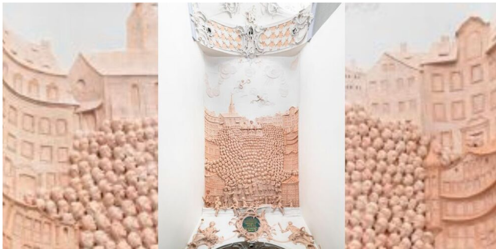
Eine Landsgemeinde von Appenzell Ausserrhoden in Trogen. Deckenstuckatur im Treppenaufgang des Gemeindehauses von Trogen, gestaltet zwischen 1766 und 1779 von Andreas oder Peter Moosbrugger

Schliesslich wurde ausgezählt: 1499 Stimmen für von Heimen, 1422 für Gartenhauser. Die Katholiken übernahmen nun die gesamte Regierung. Doch der Streit war nicht beigelegt. Die folgenden Monate waren geprägt von weiteren Schreiben und gegenseitigen Vorwürfen. Die Gräben zwischen inneren und äusseren Rhoden waren unüberwindbar geworden.