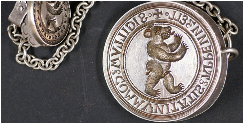
In Silber gestochenes, grosses und kleines Landessiegel des ungeteilten eidgenössischen Standes Appenzell. Gemäss Gravur auf der Rückseite wurde das grosse Siegel 1518 angefertigt. Das Siegelbild zeigt den aufrechten Bären

Im März 1588 wurde unter Vermittlung der Eidgenossenschaft ein verschärfter Glaubensvertrag beschlossen, der es der Mehrheit einer Kirchgemeinde erlaubte, Andersgläubige entweder zum Glaubensübertritt oder zur Auswanderung zu zwingen. Zahlreiche protestantische Appenzellerinnen und Appenzeller liessen sich daraufhin in der reformierten Stadt St.Gallen nieder und erhielten dort das Bürgerrecht.