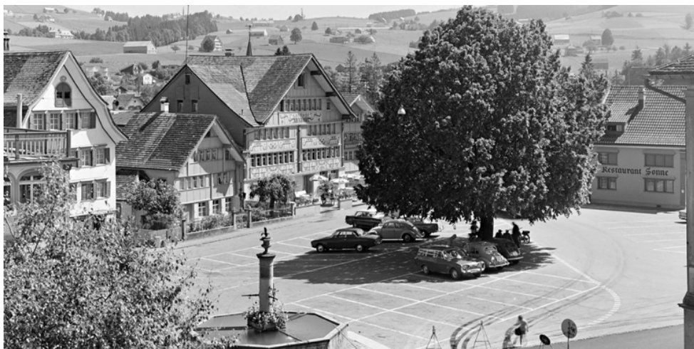
Der Landsgemeindeplatz in Appenzell, Foto 1965. Auf diesem Platz entschied sich 1588 und 1589 das Schicksal des gemeinsamen Standes: Unter offenem Himmel und mit erhobenen Händen

Dann folgte eine diskrete, aber deutliche Anspielung: Die Appenzeller Obrigkeit sei selbst für die Misere verantwortlich, da sie keine Einigkeit im Lande erreichen könnten (Nr. 1224).