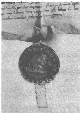
Siegel des Heiliggeist-Spitals auf einer Urkunde von 1303 (StadtASG, SpA, Tr. B,1 No. 6b).

(Vom Bearbeiter dieses Verzeichnisses ist überdies eine sozialgeschichtliche Dissertation über die Insassen des Heiliggeist-Spitals und anderer städtischer Anstalten in der zweiten Hälfte des 18. Jahrhunderts im Gange.)