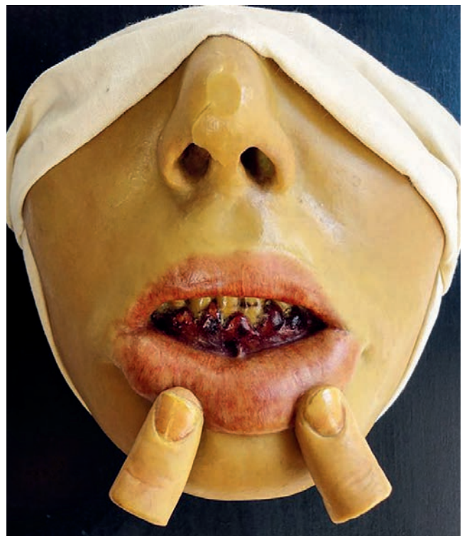
Die Wachsmoulage zeigt typische Symptome wie Zahnfleischbluten bei Skorbut auf.

Ein weiteres Problem betraf die Gesundheit und Hygiene. Bereits kurz nach der Anstaltsgründung 1663 fiel die schlechte Ernährung der Kinder auf. Die Kinder erhielten nur Mus, «dz selbige [Kinder] fast alle gar bleich und übel von angesicht außsehen und also bey dieser kost nicht wol zur arbeit gehalten» 45 . Sie waren laut Stadtarzt Bartholome Schobinger so schlecht ernährt, dass sie nicht mehr arbeiten konnten. Erst auf seine Intervention hin erhielten die Kinder zusätzliche Beilagen wie Bohnen, Erbsen, Gerste oder Milch und am Sonntag ein wenig Fleisch, Wein oder Most. Bei dieser Nahrungsverbesserung stand aber nicht unbedingt das persönliche Wohl im Zentrum, vielmehr spielte auch hier der Hintergedanke mit, dass die Kinder kräftig genug für die Arbeit sein sollten. 46 1669, sechs Jahre nach der Zuchthausgründung, besprachen die zuständigen Verwaltungsmitglieder des Zuchthauses erneut den schlechten gesundheitlichen Zustand der Kinder: Der Grund bei einigen «erkrankenden und serbenden [langsam sterbenden] kindern» 47 wurde im «uebermaß und schärfpffe der arbeit herkommen vermuthet oder wol auch von dem übeln geruch der priveten [Toiletten]» 48 . Zwanzig Jahre später sprachen die Verantwortlichen immer noch von «besorgenden krankheiten» 49 . Eine häufige Krankheit war beispielsweise die rote Ruhr, eine lebensbedrohli-