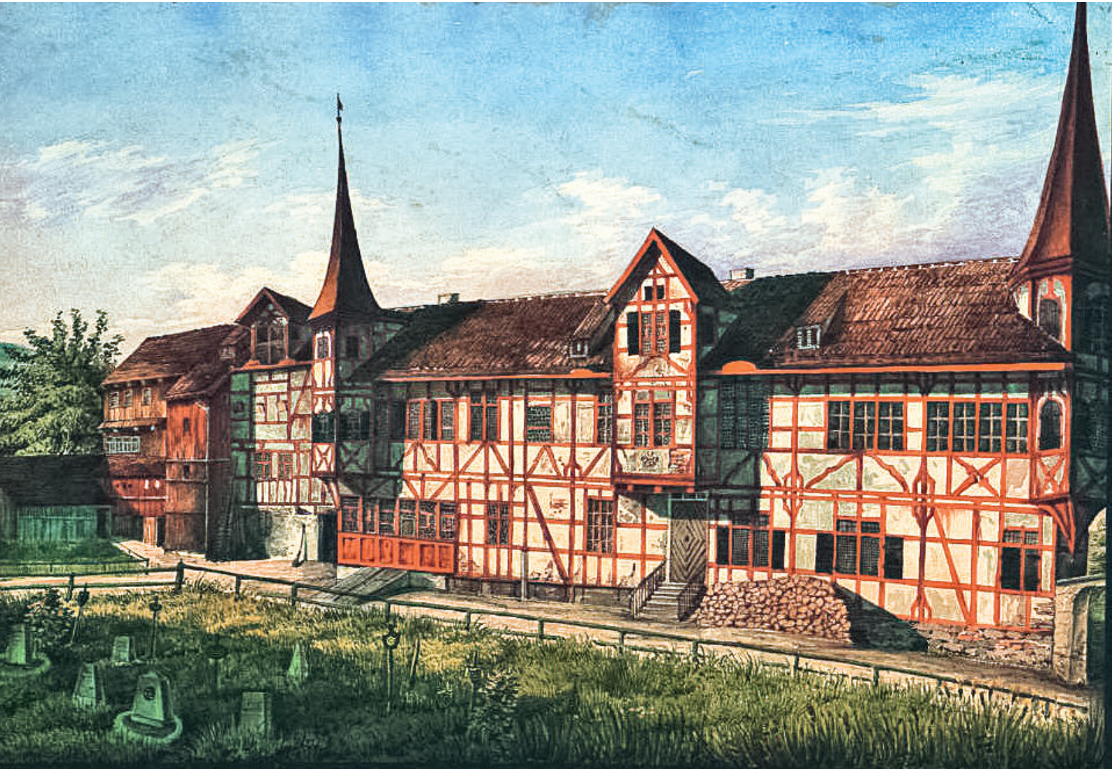
Das Zucht- und Waisenhaus St. Leonhard im alten Kloster. Kantonsbibliothek Vadana St. Gallen (KBV), GS q 2 H /12, 1844.