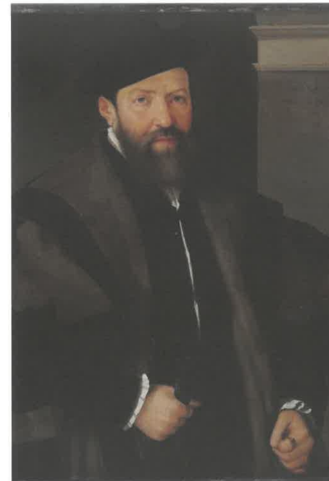
Hieronymus Sailer, 90 x 80 cm von Christoph Amberger 1538, Alte Pinakothek München, L. 255