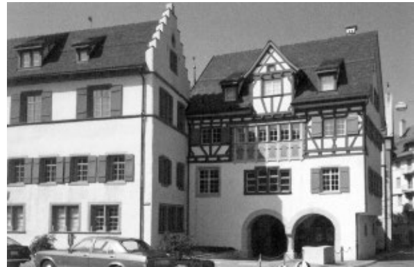
Der Eingang zum ehemaligen Katharinenkloster

St.Gallen war im Spätmittelalter eine eher kleine Stadt mit ungefähr 3'000 Einwohnern. Da verwundert es nicht, dass viele der reichen und mächtigen Familien miteinander verbandelt waren. Das gleiche Bild ergibt sich, wenn wir die Stammbäume der Nonnen von St.Katharinen zusammenstellen: Hinter den Klostermauern trafen sich Schwestern, Cousinen und Grosstanten.